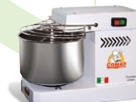
Impastatrici da 5 a 50Kg